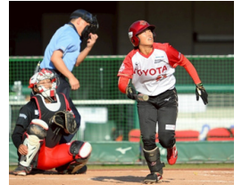
【デンソーブライトペガサス(愛知)】【太陽誘電ソルフィエユ(群馬)】【タカギ北九州ウォーターウェーブ(福岡)】【トヨタレッドテリアーズ(愛知)】