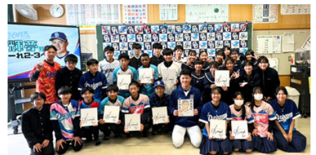
【生徒の皆さんと記念撮影♪】