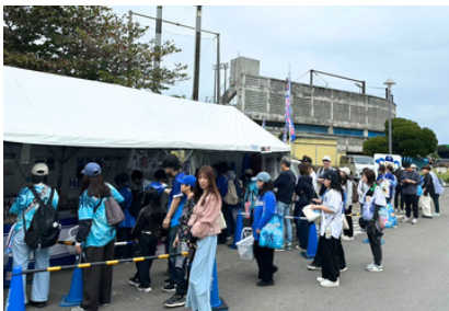
グッズ売り場は連日の行列！

2月1日（日）からスタートしました、2026中日ドラゴンズ春季キャンプは、初日から大盛況。オキハム読谷平和の森球場には多くのファンが詰めかけ、駐車場に併設されたグッズ売り場は、オープン前からファンの行列ができる盛況ぶり。今年もファンの盛況ぶりに圧倒されながらのキャンプでした。今年のキャンプ来場者数：約22,000人（24日間）