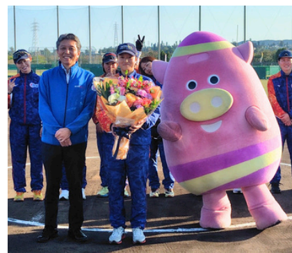
【日立サンディーバ (横浜市) 女子ソフトボール 読谷キャンプ歓迎セレモニーの様子】

2月3日(火)より読谷村にキャンプしたのは、横浜市戸塚区に本拠地を置く、日立サンディーバ女子ソフトボールチームです。キャンプは、ゆんたんざソフトボール場にて2月15日(日)までの約2週間のキャンプ期間でした。