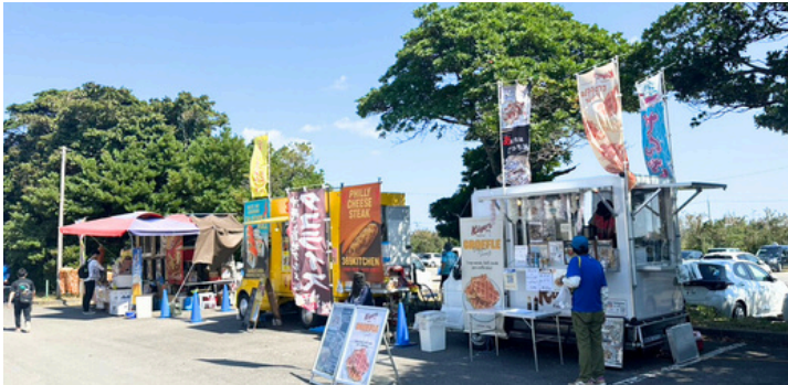
美味いものキッチンカー 出店も楽しみのひとつ♪