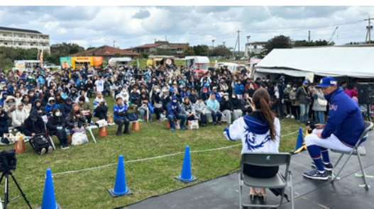
2軍監督とのトークショーは大盛況♪

美味しいお食事やレアグッズの当たるお楽しみ抽選会は、大行列の大盛り上がり。ステージでは空手の演武やエイサーなどが披露されました。