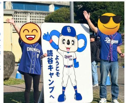
ドラアの看板前は、 みんなのフォトスポット♪

2月1日（日）からスタートしました、2026中日ドラゴンズ春季キャンプは、初日から大盛況。オキハム読谷平和の森球場には多くのファンが詰めかけ、駐車場に併設されたグッズ売り場は、オープン前からファンの行列ができる盛況ぶり。今年もファンの盛況ぶりに圧倒されながらのキャンプでした。今年のキャンプ来場者数：約22,000人（24日間）