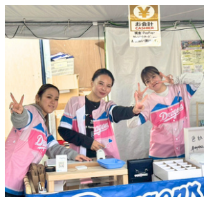
グッズの売り子ちゃん達♪