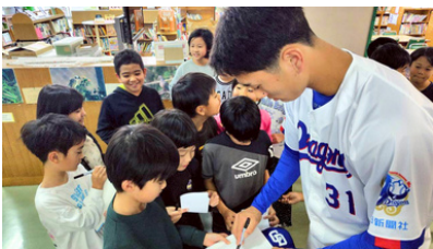
【生徒のサイン攻撃にも神対応♪】

2月4日のキャンプ初のオフ日に、村内7カ所の小・中学校でドラゴンズのルーキーの皆さんが交流を行った。小学校では体育館で生徒たちと触れ合い、中学校では給食に参加して生徒と給食を楽しみました。