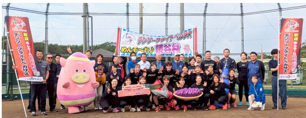
【デンソーブライトペガサス (愛知県刈谷市) 女子ソフトボール 読谷キャンプ歓迎セレモニーの様子】